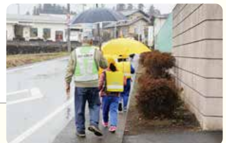
南北小学校見守り