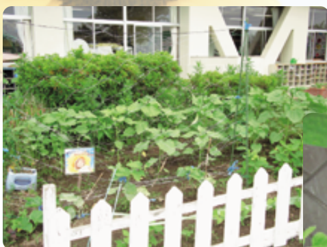
※写真は広報紙発行時の様子です。

ンターの利用者の方たちにより、ふれあい館と福祉センターにも「はるかのひまわり」が植えられました。個人で植えて下さった方も多く、この夏、様々な「おもい」が込められた「はるかのひまわり」が榛東村にも咲きます。