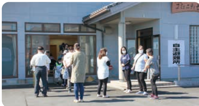
避難所に指定されている第18区コミュニティセンターへ速やかに避難