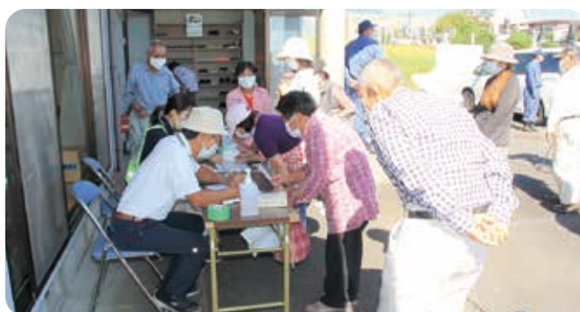
避難所開設及び避難者(訓練参加者)の確認(受付 自治会役員・役場職員)