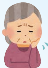
村民無料法律相談予定表